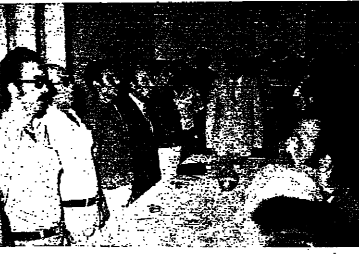
رعيدي وروكر ومسؤولو الحزب ينشون التشيد الكتابي في بداية الاجتماع